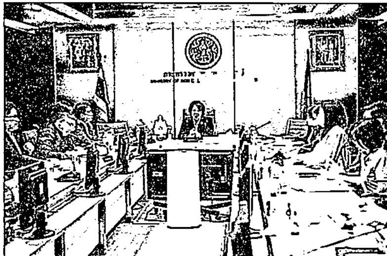
ประชุม : น.ส.ภัทราภรณ์ ไสเจอมะ รองปลัดกระทรวงเกษตรและสหกรณ์ ประชุมคณะทำงานปรับปรุงกระบวนการเพื่อเพิ่มประสิทธิภาพการช่วยเหลือเกษตรกรผู้ประสบภัยธรรมชาติ ด้วยวิธีการทางวิทยาศาสตร์ฯ ครั้งที่ 1/2567 เพื่อแลกเปลี่ยนแนวทาง วิธีการนำเทคโนโลยี สำรวจความเสียหายจากภัยพิบัติธรรมชาติ

ทั้งนี้ ที่ประชุมมีมติเห็นชอบให้ใช้รูปแบบระบบปฏิบัติการและแนวทางการที่ GISTDA ได้ทำการศึกษามาเบื้องต้นร่วมกับหน่วยงานในสังกัดกระทรวงเกษตรและสหกรณ์พิจารณารูปแบบการประเมินความเสียหายจากน้ำท่วม เพื่อเพิ่มประสิทธิภาพในการช่วยเหลือเกษตรกรให้สูงขึ้น และมอบหมายให้หน่วยงานส่งผู้แทนที่มีความเชี่ยวชาญทำงานร่วมกับ GISTDA เพื่อสนับสนุนข้อมูลเชิงพื้นที่ และข้อมูลที่เกี่ยวข้อง นำไปศึกษาทดลอง ความเป็นไปได้ในทางปฏิบัติ โดยจะเริ่มดำเนินงานในพื้นที่ร่องนาทดลอง พื้นที่ปลูกข้าวนาปี และผลไม้เศรษฐกิจมูลค่าสูง เพื่อตรวจสอบความแม่นยำในการยืนยันความเสียหายจากภัยพิบัติ เพื่อก่อให้เกิดความเชื่อมั่นของทั้งภาครัฐ เกษชน และเกษตรกร และจะเสนอต่อคณะทำงานในครั้งต่อไป