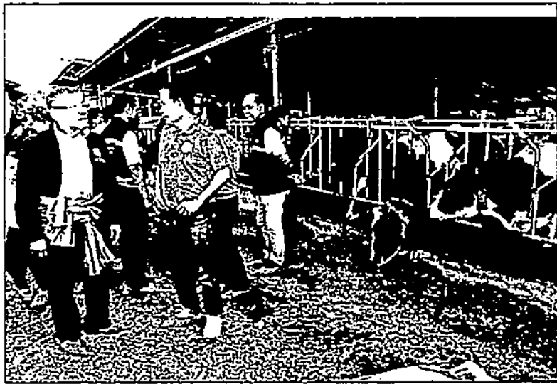
เร่งผลิต : นายอิทธิ ทิริลัทธยากร รมช.เกษตรและสหกรณ์ ตรวจเยี่ยมสหกรณ์โคนมเขตปฏิรูปที่ดินชัยสนุน จำกัด อ.สระบุรี โดยมอบนโยบายลดต้นทุนอาหารสัตว์ด้วยการเร่งรัดโครงการผลิตอาหารหยาบคุณภาพสูง ใช้ข้าวโพดหมัก เพิ่มประสิทธิภาพผลผลิตโคนม ช่วยลดต้นทุนด้านอาหารสัตว์ให้เกษตรกรผู้เลี้ยงโคนม

โอกาสนี้ รมช.เกษตรฯ กล่าวชื่นชมสหกรณ์โคนมในเขตปฏิรูปที่ดินชัยสนุน จำกัด ที่มีความตั้งใจในการพัฒนาเพื่อยกระดับคุณภาพการผลิตน้ำนมดิบและสร้างความยั่งยืนให้กับสมาชิก สำหรับสหกรณ์แห่งนี้ จัดทะเบียนจัดตั้งเป็นสหกรณ์ เมื่อวันที่ 28 พฤษภาคม 2547 ปัจจุบันดำเนินธุรกิจมา 20 ปี มีสมาชิกทั้งหมด 186 ราย 128 ฟาร์ม โคนม 5,706 ตัว พื้นที่ดำเนินการตำบลชัยสนุน ต.ลำพญากลาง ต.หนองบัวเสือ จ.สระบุรี และ ต.ห้วยขุนราม จ.ลพบุรี มีศูนย์