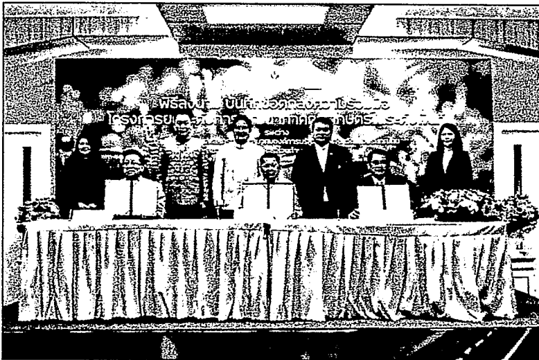
ทำMOU : นายอัครา พรหมเผ่า รัฐมนตรีและสหกรณ์ พร้อมคณะ ร่วมพิธีทำบันทึกข้อตกลงความร่วมมือ (MOU) ยกระดับพัฒนาภาคการเกษตร ร่วมกับสมาคม อบจ. และ อบต.พร้อมสนับสนุนการดำเนินงานของทุกภาคส่วน ภายใต้นโยบาย “ตลาดนำนวัตกรรมเสริม เพิ่มรายได้” บูรณาการพัฒนากิจกรรมเกษตรในพื้นที่

นอกจากนี้ภายในงานมีกิจกรรมเสวนา “โครงการยกระดับการพัฒนาภาคการเกษตรในระดับพื้นที่” เพื่อแลกเปลี่ยนความรู้ และประสบการณ์ต่างๆ เพื่อนำมาพัฒนาท้องถิ่น รวมถึงองค์ความรู้ที่จะสามารถนำมาปรับใช้ในภาคการเกษตรในระดับพื้นที่ ตลอดจนการทำเกษตรมูลค่าสูงในอนาคต